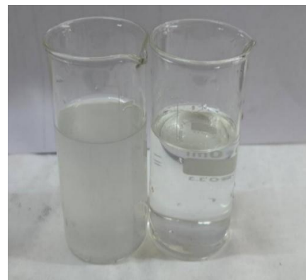
3-rasm. Vinilxlorid monomeri ishlab chiqarish sexining texnologik eritmalarini tindirishdan oldingi va keyingi ko'rinishi.

Tindirilib, filtrlangan eritmalarining rentgen fluresensiya usulida tahlil natijalari 1-2-jadvada keltirilgan.