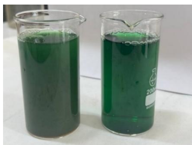
2-rasm. AKN eritmasining tindirishdan oldingi va keyingi ko'rinishi.