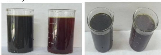
1-rasm. Tiomochevina ishlab chiqarish chiqindi eritmasining tindirish va filtrlashdan oldingi va keyingi ko'rinishi.

Tadqiqot obyekti sifatida "Navoiyazot" AJning 14-akril kislotasi nitrili (AKN) ishlab chiqarish sexi, 201-tiomochevina ishlab chiqarish sexi va 911-vinilxlorid monomeri ishlab chiqarish sexining texnologik oqova suvlari tanlangan. Dastlab chiqindi eritmalarini neytrallashtirish jarayoniga jo'natilishidan oldin suspenziya shaklidagi zarrachalarni tindirish maqsadida, filtrlanadi, natijada ayrim metallar, ularning birikmalari va keraksiz jinslar cho'kmaga tushdi. Yirik zarrali birikmalar oson cho'kadi, ammo metall birikmalarining cho'kma tarkibiga o'tish darajasi minimal bo'ldi. Eritmalarni rangi ancha tiniqlashdi (1-3-rasm).