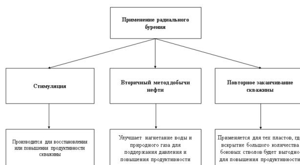
Рис.1. Применение радиального бурения.

Оценка технологической и экономической эффективности технологии радиального вскрытия пласта осуществлена на основе информации АО «Узбекнефтегаз» и компании «Radial Drilling Services INC» (США), приведённых в официальных сайтах и презентационных материалах [14; 15; с. 21-25].